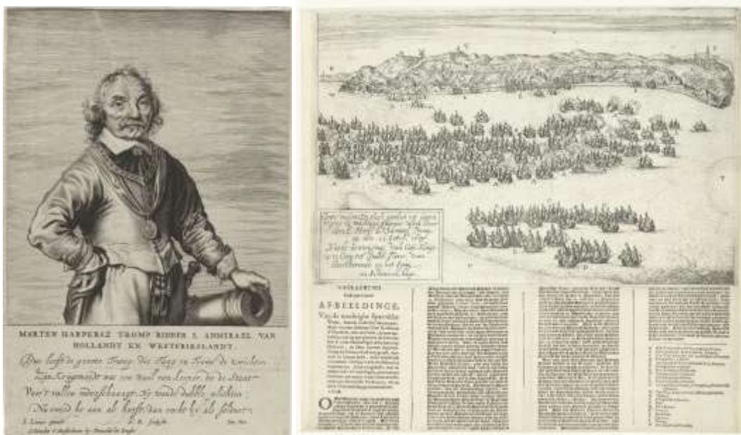
Maarten Harpertzoon Tromp / De rede van Duins, de armada ingesloten door Tromps vloot

huis, kan hij zich gemakkelijk door kleine vrachtschepen laten bevoorraden terwijl de Spanjaarden ver van huis zijn.